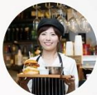
スタッフ業務を 効率化