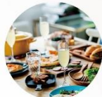
受付から配席までを 自動化