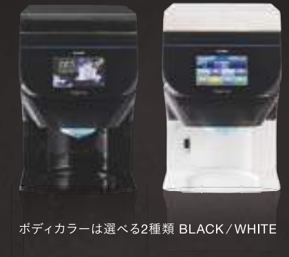
ボディカラーは選べる2種類 BLACK/WHITE