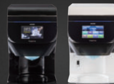
ボディカラーは選べる2種類 BLACK/WHITE