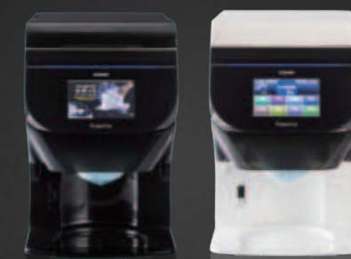
ボディカラーは選べる2種類 BLACK/WHITE