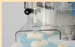
二次成形・わさび自動塗布