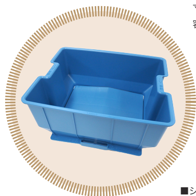
■補助ホッパー 寸法/380W×310D×176Hmm 容量/約3升