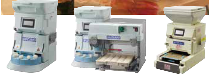
小型シャリ玉ロボット SSN-JLA/JRA 能力：最大4800カン/時 シャリ玉移栽装置付 小型シャリ玉ロボット SSN-JLA+TRS-JLA 能力：最大4200カン/時 海苔巻きロボット SVR-NVG 能力：280~400本/時

コスト削減、省力化・省技術化を図り “作りたてのおいしさ”を提供する米飯ロボット