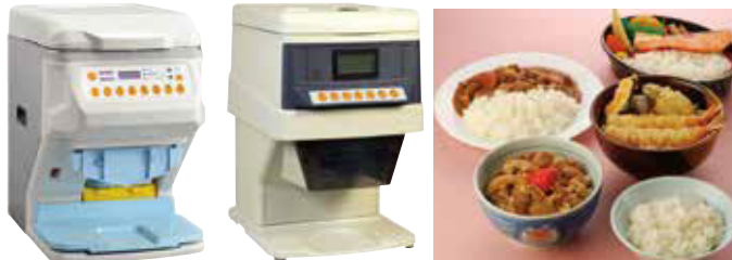
シャリ弁ロボ GST-HMA 能力：5秒/回 シャリ弁ロボ GST-FBB 能力：5秒/回 有名丼チェーンをはじめ、レストラン、病院・介護施設、企業給食等でも活躍中!!

確かな計量と優れたほぐし機能を搭載。 作業時間の短縮、商品の均一化が図れる盛り付け機。