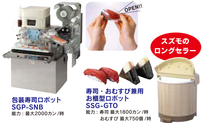
包装寿司ロボット SGP-SNB 能力：最大2000カン/時 寿司・おむすび兼用 お櫃型ロボット SSG-GTO 能力：寿司 最大1800カン/時 おむすび 最大750個/時

確かな計量と優れたほぐし機能を搭載。 作業時間の短縮、商品の均一化が図れる盛り付け機。