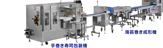
手巻き寿司包装機 手巻きおむすび、パクダンおむすび、海苔巻きシート、多彩にアレンジができる!! シートおむすび製造ライン ESS-AMB 能力：3300個/時

海苔巻き成形機 + 包装機で省人化を実現します!! 連続海苔巻き成形機+手巻き寿司包装機 SVR-SAE-W50+PNR-SVC