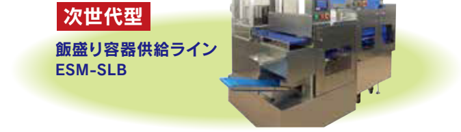
次世代型 飯盛り容器供給ライン ESM-SLB

海苔巻き成形機 + 包装機で省人化を実現します!! 連続海苔巻き成形機+手巻き寿司包装機 SVR-SAE-W50+PNR-SVC