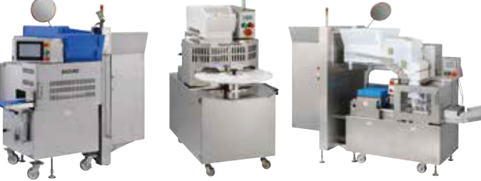
計量盛り付け機 ESK-BLC 能力：最大2000食/時 いなり寿司ロボット FIS-SND 能力：最大2500個/時 シャリ玉量産機 STF-MFA 能力：最大13000カン/時